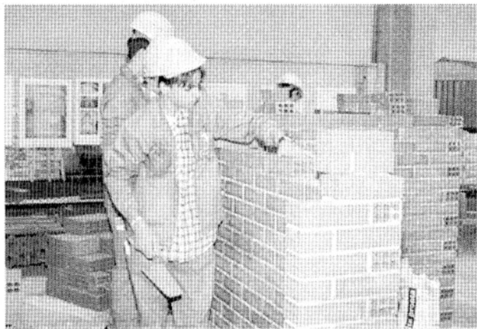
STAND Operai simulano il lavoro in un cantiere edile

Ma la vera novità quest'anno è rappresentata dall'abbinamento con "Progetto&Arredo", una sezione dedicata all'arredamento e all'habitat, uno spazio interamente dedicato alla casa. Agli occhi dei visitatori però, semplici curiosi ma anche esperti del settore, sono risultati interessanti i laboratori dove gli artigiani del restauro e della decorazione hanno prodotto le loro