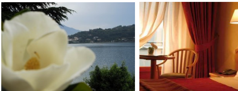
HOTEL CHALET DEL LAGO ★★★, AVIGLIANA, riva lago