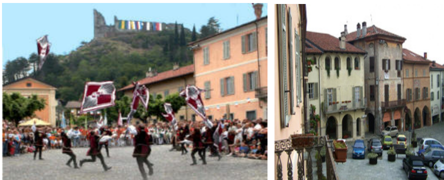
OSTELLO CONTE ROSSO, AVIGLIANA, centro storico